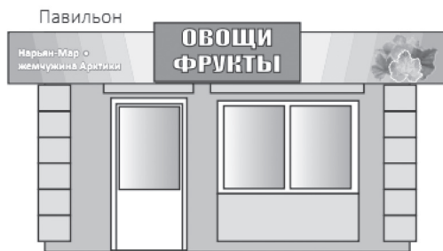
2. Типовые варианты павильонов