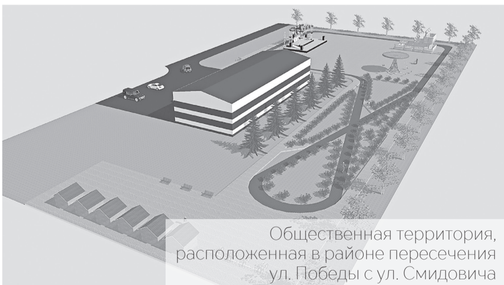
Общественная территория, расположенная в районе пересечения ул. Победы с ул. Смидовича