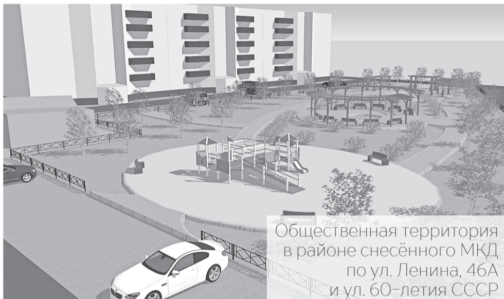
Общественная территория в районе снесённого МКД по ул. Ленина, 46А и ул. 60-летия СССР