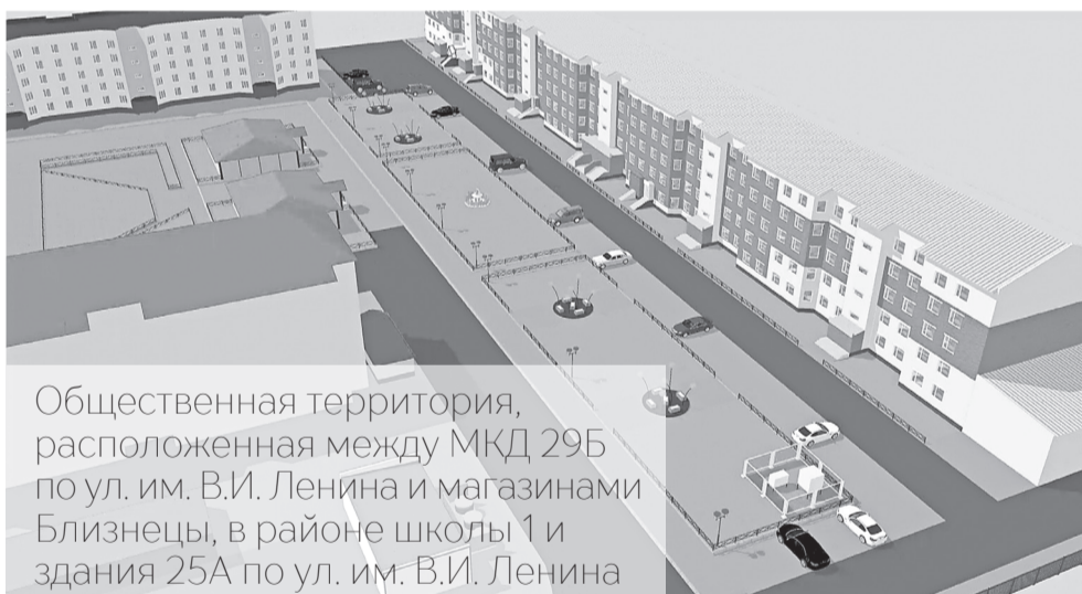
Общественная территория, расположенная между МКД 29Б по ул. им. В.И. Ленина и магазинами Близнецы, в районе школы 1 и здания 25А по ул. им. В.И. Ленина