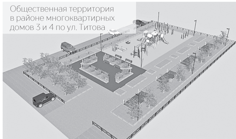
Общественная территория в районе многоквартирных домов 3 и 4 по ул. Титова