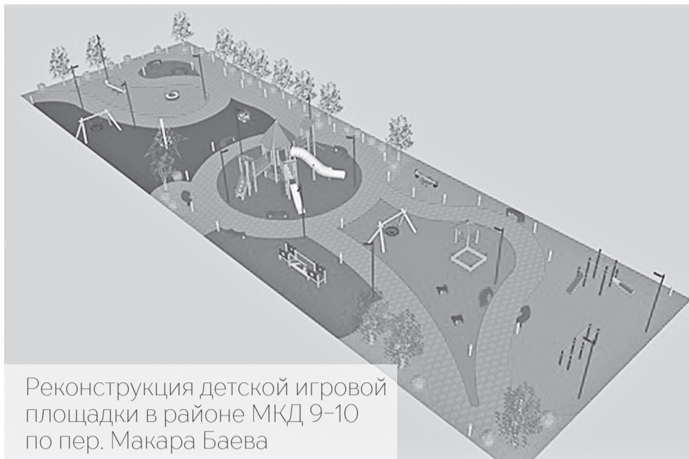
Реконструкция детской игровой площадки в районе МКД 9–10 по пер. Макара Баева

Представляем читателям семь территорий Нарьян-Мара, которые будут благоустроены в рамках проекта «Формирование комфортной городской среды» в 2024 году, и за которые горожане смогут проголосовать до 30 мая 2022 года.