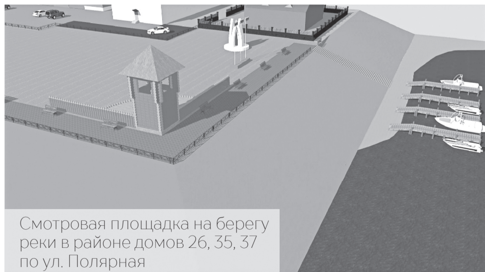
Смотровая площадка на берегу реки в районе домов 26, 35, 37 по ул. Полярная