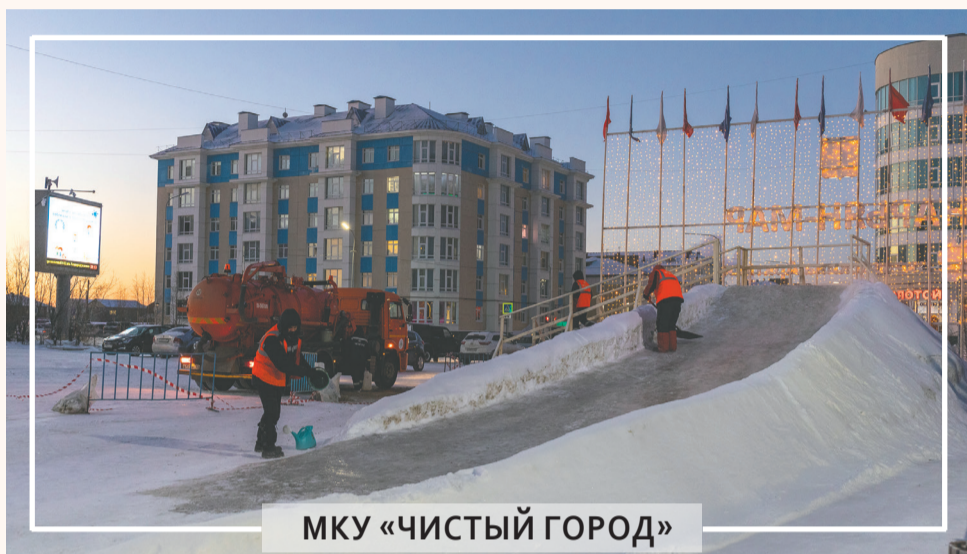
МКУ «ЧИСТЫЙ ГОРОД»