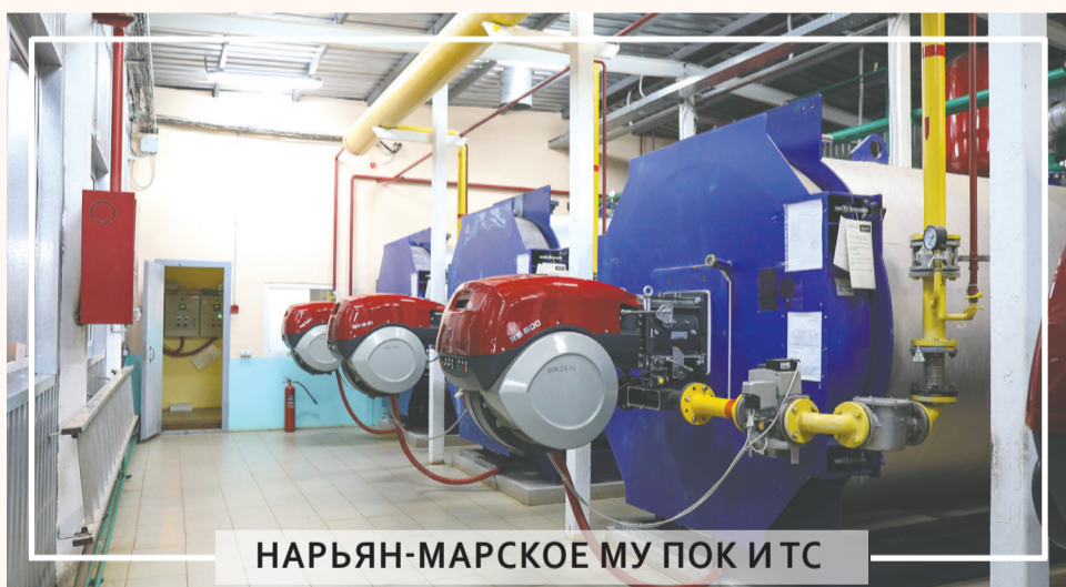
НАРЬЯН-МАРСКОЕ МУ ПОК И ТС