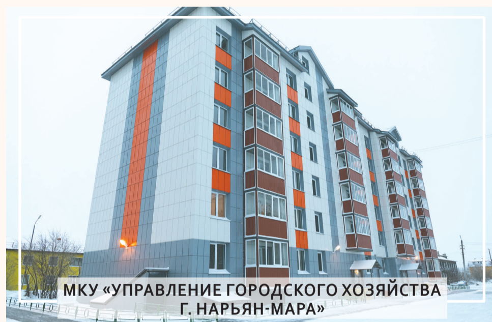
МКУ «УПРАВЛЕНИЕ ГОРОДСКОГО ХОЗЯЙСТВА Г. НАРЬЯН-МАРА»