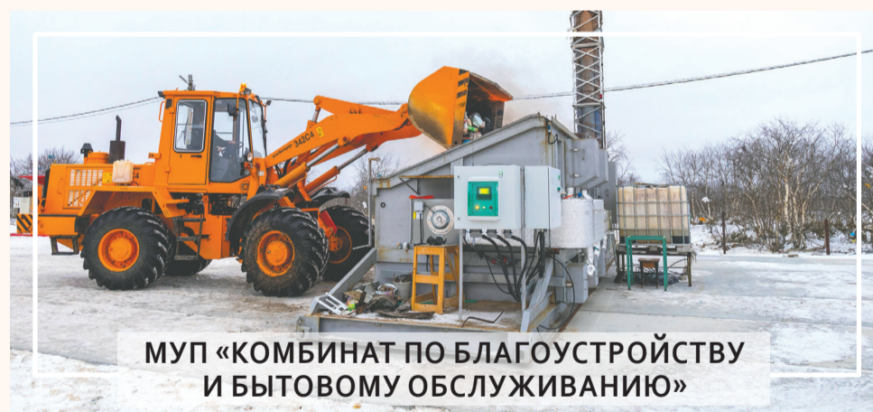
МУП «КОМБИНАТ ПО БЛАГОУСТРОЙСТВУ И БЫТОВОМУ ОБСЛУЖИВАНИЮ»