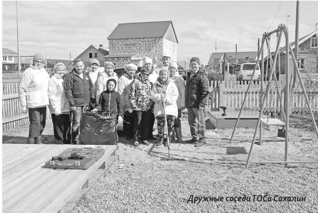
Дружные соседи ТОСа Сахалин

Традиционные помощники города весной — это студенты. Они, как когда-то пи-