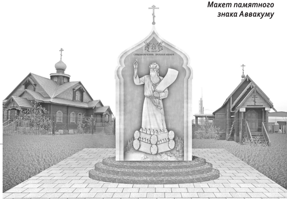
Макет памятного знака Аввакуму

В Нарьян-Маре на территории древлеправославного церковного комплекса по улице Первомайской появится памятный знак протопопу Аввакуму.