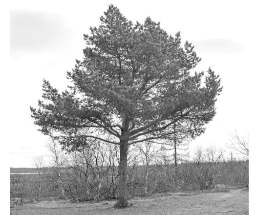
Обычную сосну найдёте в сухом лесу и на болоте

Посадка саженцев сосны осенью осуществляется в ямы глубиной 60 см, диаметром один метр и более, в зависимости от размера. Корневая шейка не заглубляется, а должна находиться на одном уровне с землей. После посадки необходим обильный полив и мульчирование почвы опилками, щепой или торфом. Помните, лучшей приживаемостью обладают деревья 4-5-летнего возраста. Если на участке