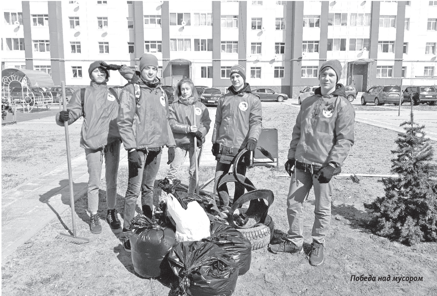
Победа над мусором

ОФИЦИАЛЬНЫЙ БЮЛЛЕТЕНЬ МО «ГОРОДСКОЙ ОКРУГ «ГОРОД НАРЬЯН-МАР»