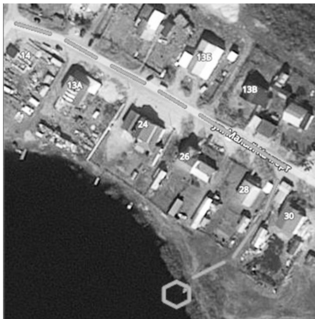
СХЕМА 4 подъезд к естественному источнику противопожарного водоснабжения в м-не «Качгорт»