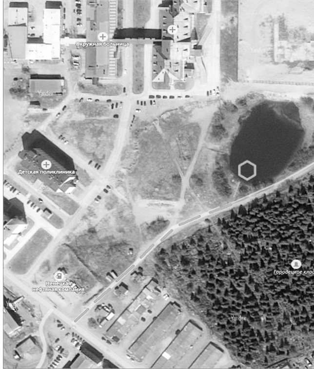
СХЕМА 13 подъезд к естественному источнику противопожарного водоснабжения в р-не ул. Первомайская, д. 19Б