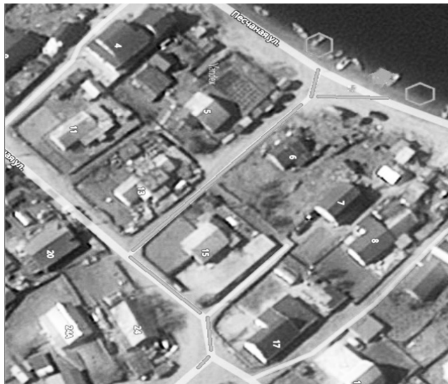
СХЕМА 2 подъезд к естественному источнику противопожарного водоснабжения в районе НАКАСЦ МЧС России