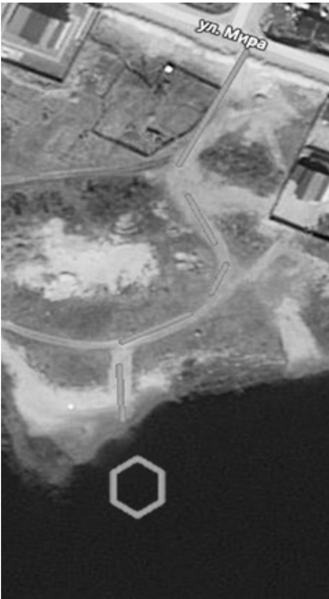
СХЕМА 11 подъезд к естественному источнику противопожарного водоснабжения в м-не «Мирный»