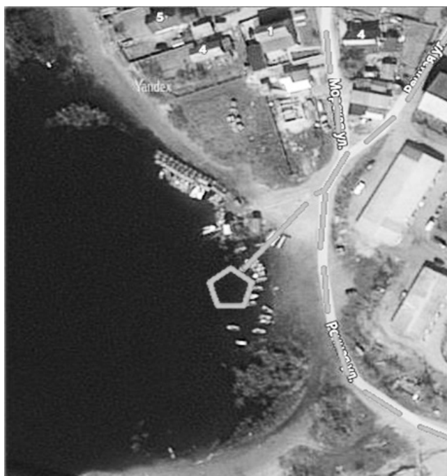
СХЕМА 4 подъезд к естественному источнику противопожарного водоснабжения в м-не «Качгорт»