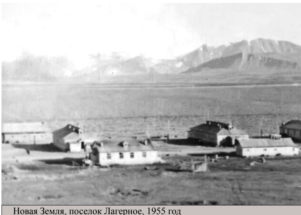
Новая Земля, поселок Лагерное, 1955 год