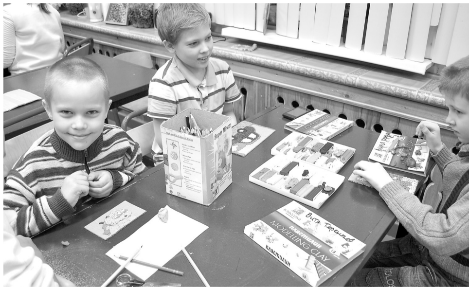
А мы любим лепить из пластилина