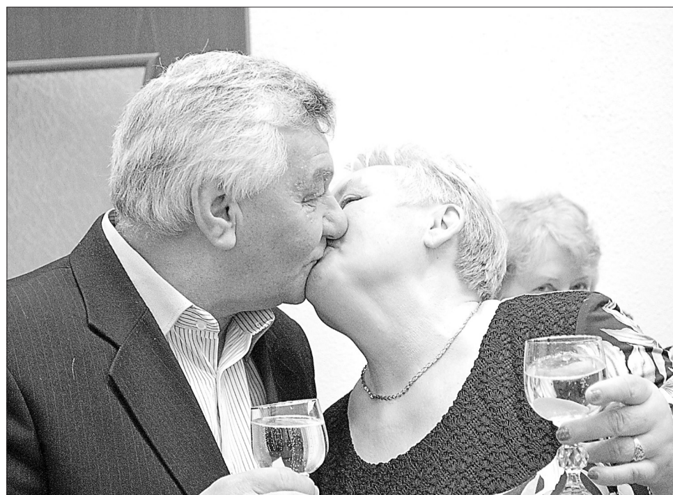
Горько, как и сорок лет назад!