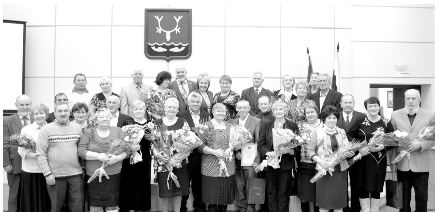
Общее фото на память