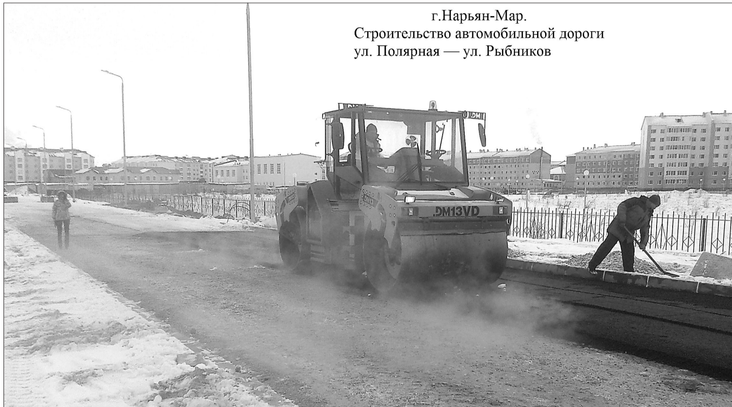
г.Нарьян-Мар. Строительство автомобильной дороги ул. Полярная — ул. Рыбников

10 октября 2015 года в "Няръяна вындер" опубликована большая, двухполосная корреспонденция под названием "Улицы, похожие на столичные". В ней столько ошибок и неточностей, что становится неловко за автора одной из авторитетных газет Ненецкого округа.