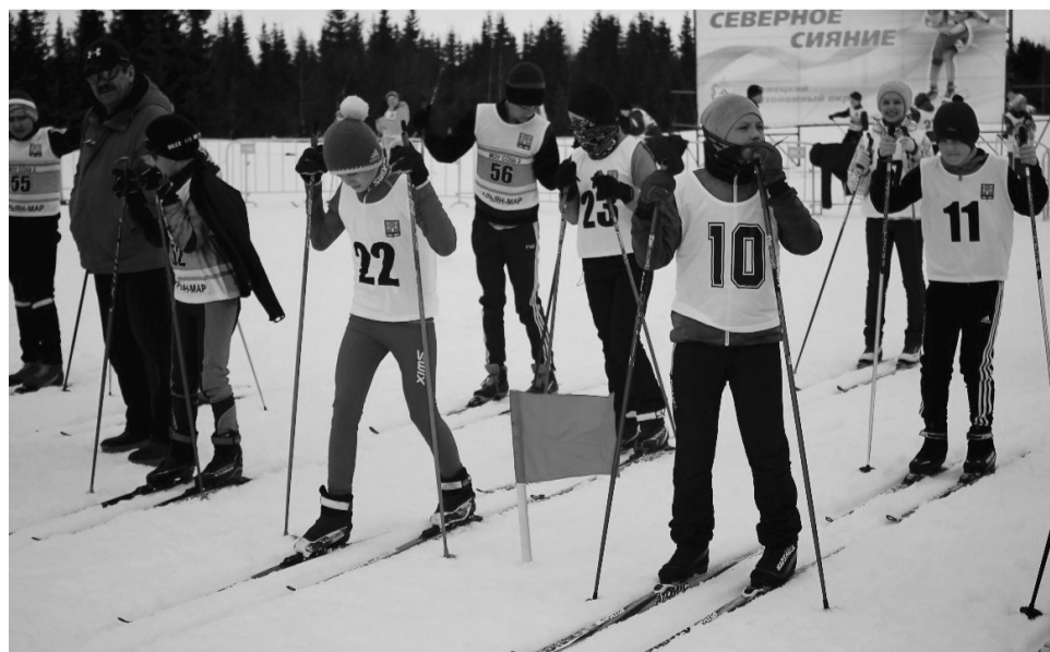
Спортивный праздник "Северное сияние" на лыжероллерной трассе ДЮСШ "Старт"