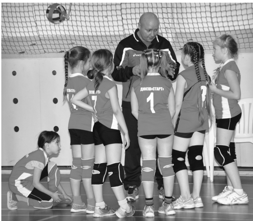
Установка на игру