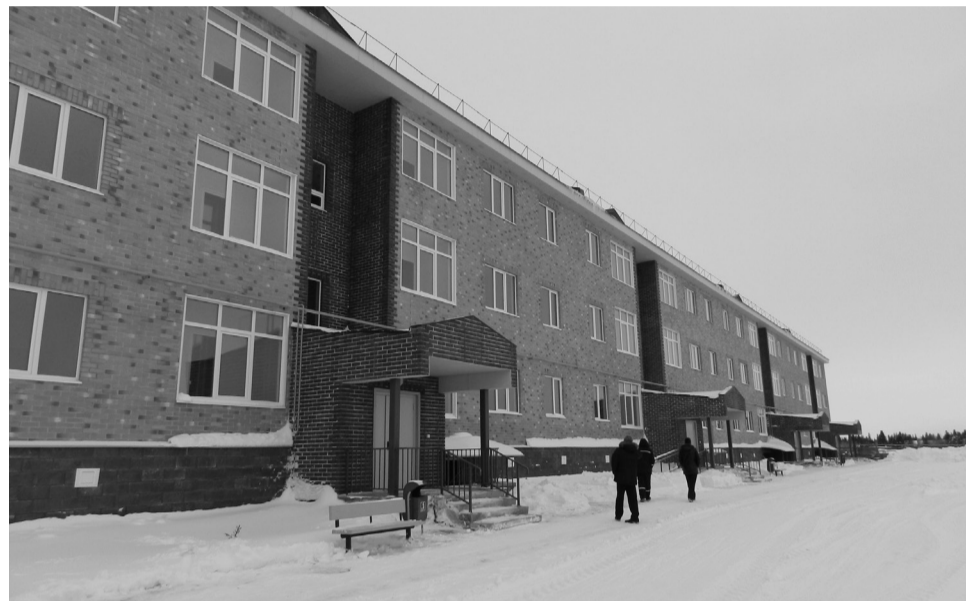
Новый микрорайон на ул.Авиаторов

Одной из причин неполного исполнения отдельных программ явилось ненадлежащее исполнение контрактов поставщиками и подрядчиками, в частности, они нарушали принятые обязательства по срокам, и нужно было проводить повторные торги, следствием чего стало позднее проведение торгов и заключение контрактов со сроками выполнения работ уже в 2015 и 2016 годах. Есть случаи расторжения контрактов по причине нарушения подрядчиками условий контрактов.