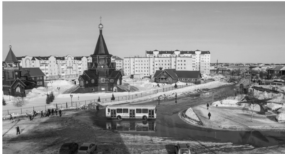
Богоявленский храм в г.Нарьян-Маре

В целях эффективного использования бюджетных ресурсов муниципального образования деятельность администрации города в решении поставленных задач осуществлялась посредством программно-целевых методов планирования, основой для которого являлись 15 действующих муниципальных программ.