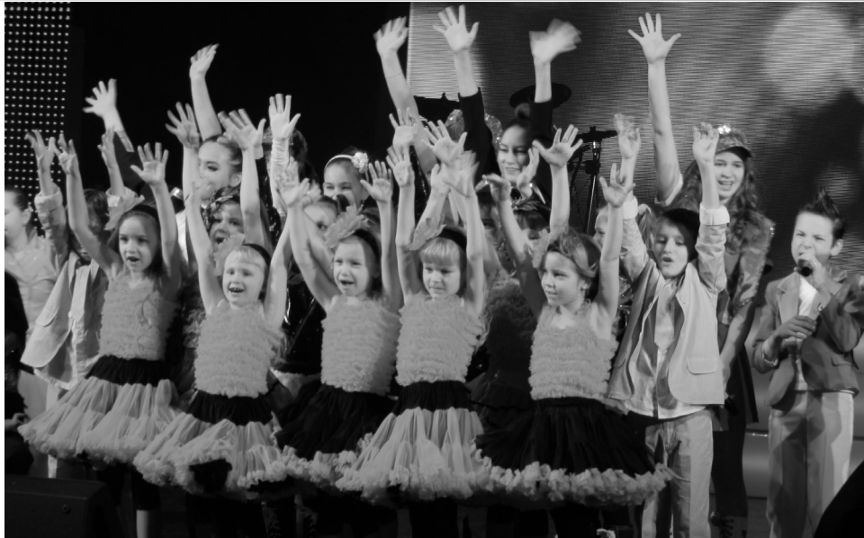
70-летие городского Дома культуры

Налажено активное взаимодействие 18 общественных организаций – федераций по видам спорта, учреждений дополнительного образования детей Ненецкого автономного округа и города Нарьян-Мара.