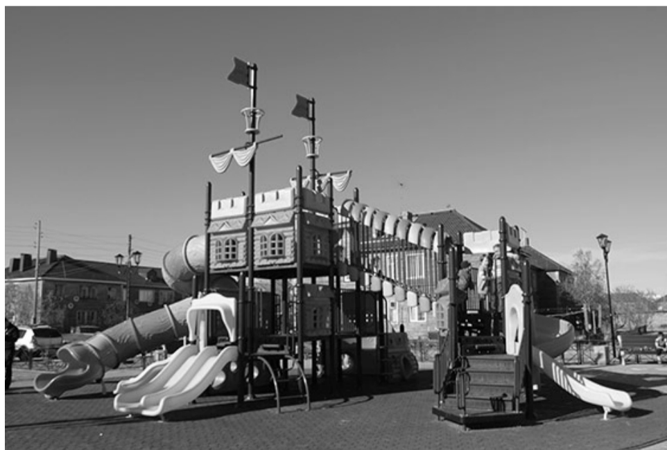
Новая детская площадка

Разработка проектной документации на строительство школы №3 на 700 мест ведется ООО «ВерсоМ» с отставанием от графика. В связи с чем, в октябре 2014 года Управлением городского хозяйства была направлена претензия о ненадлежащем исполнении принятых обязательств со стороны подрядчика.