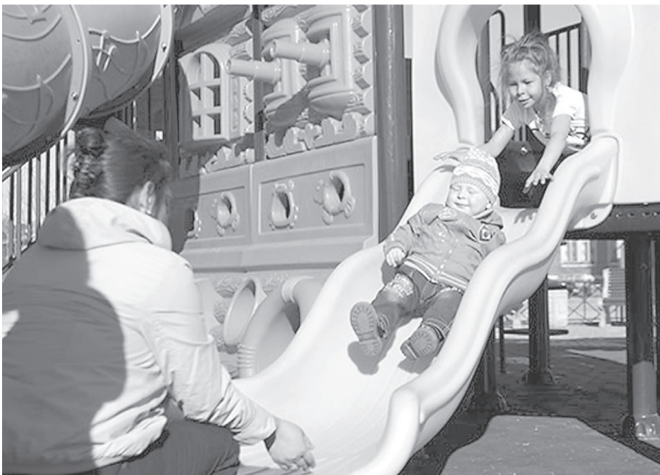
Новые детские площадки появились в нескольких районах Нарьян-Мара

В Качгорте и Малом Качгорте работники МБУ «Чистый город» проложили 900 метров электропровода для обеспечения уличного освещения, установили 8 дополнительных опор и 27 новых светильников.