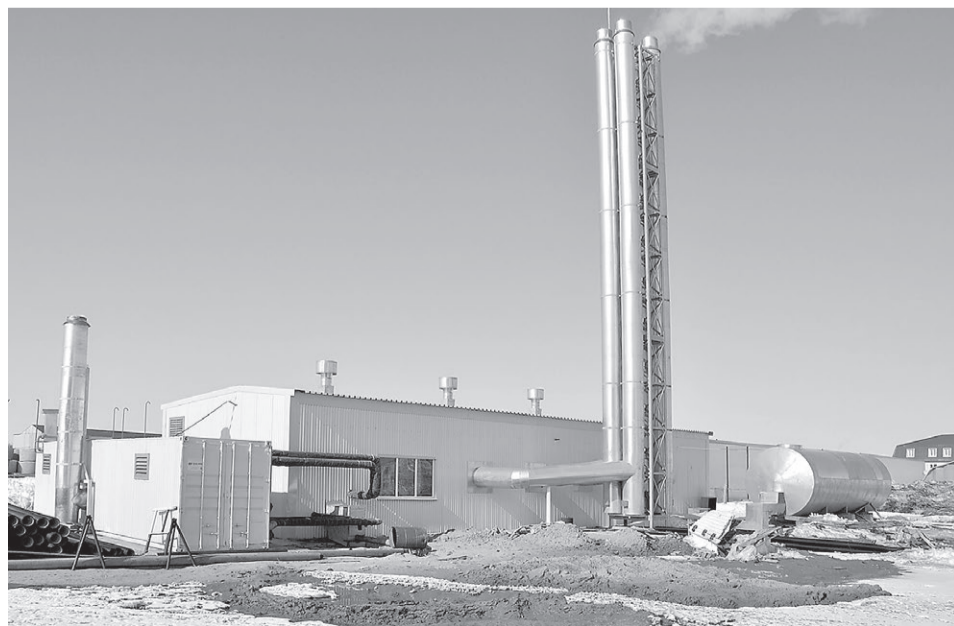
Модульная котельная на улице Авиаторов

Разработка проектной документации на строительство школы №3 на 700 мест ведется ООО «ВерсоМ» с отставанием от графика.