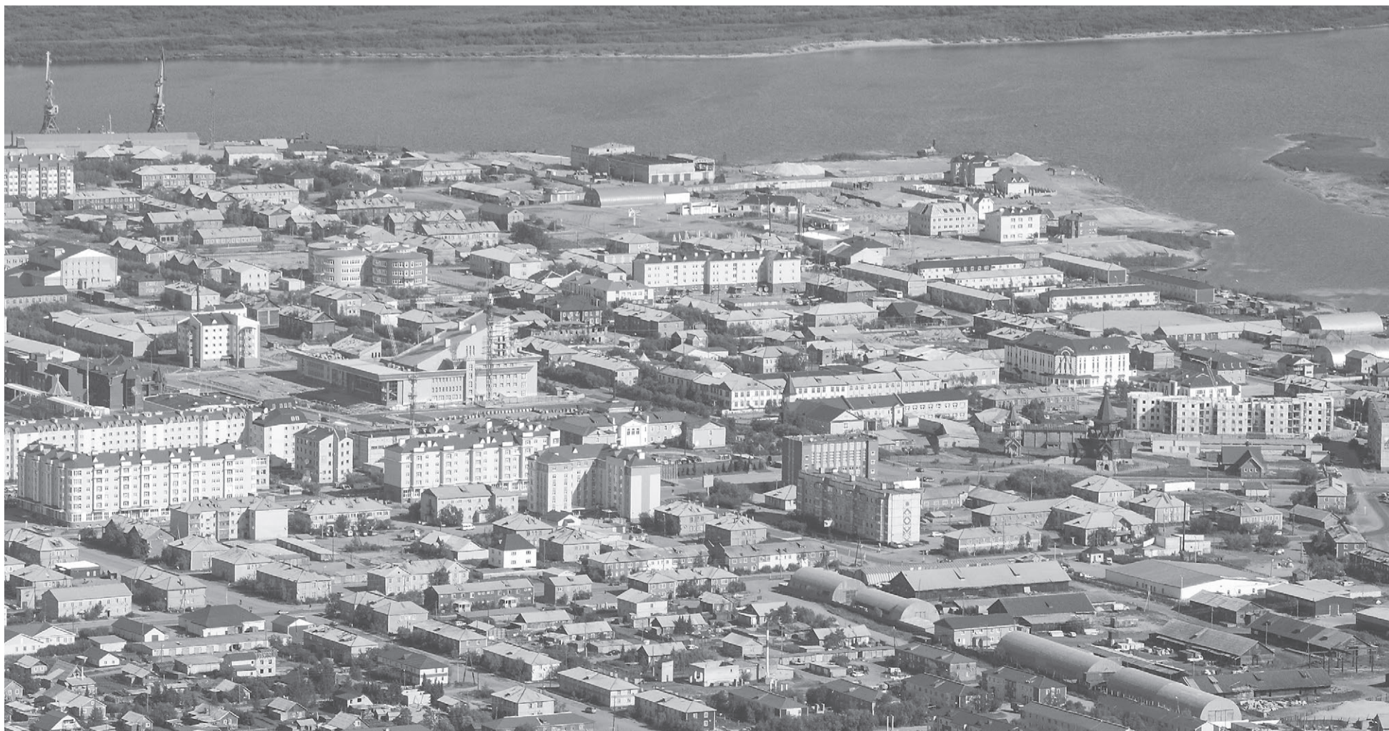
Вид Красного города с высоты полета

В 2014 году за счет субвенции на изготовление и установку надгробных памятников с целью увековечивания памяти участников Великой Отечественной войны 1941–1945 годов, умерших до 12 июня 1990 года, закуплено 49 памятников.