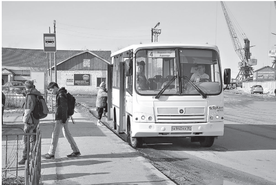
Новые автобусы Нарьян-Марского АТП

Предприятие работает стабильно, достойно выполняя производственные задания, в отчетном периоде за счет средств городского бюджета приобретен автобус ПА3. За последние годы автобусный парк обновлен на 11 единиц.