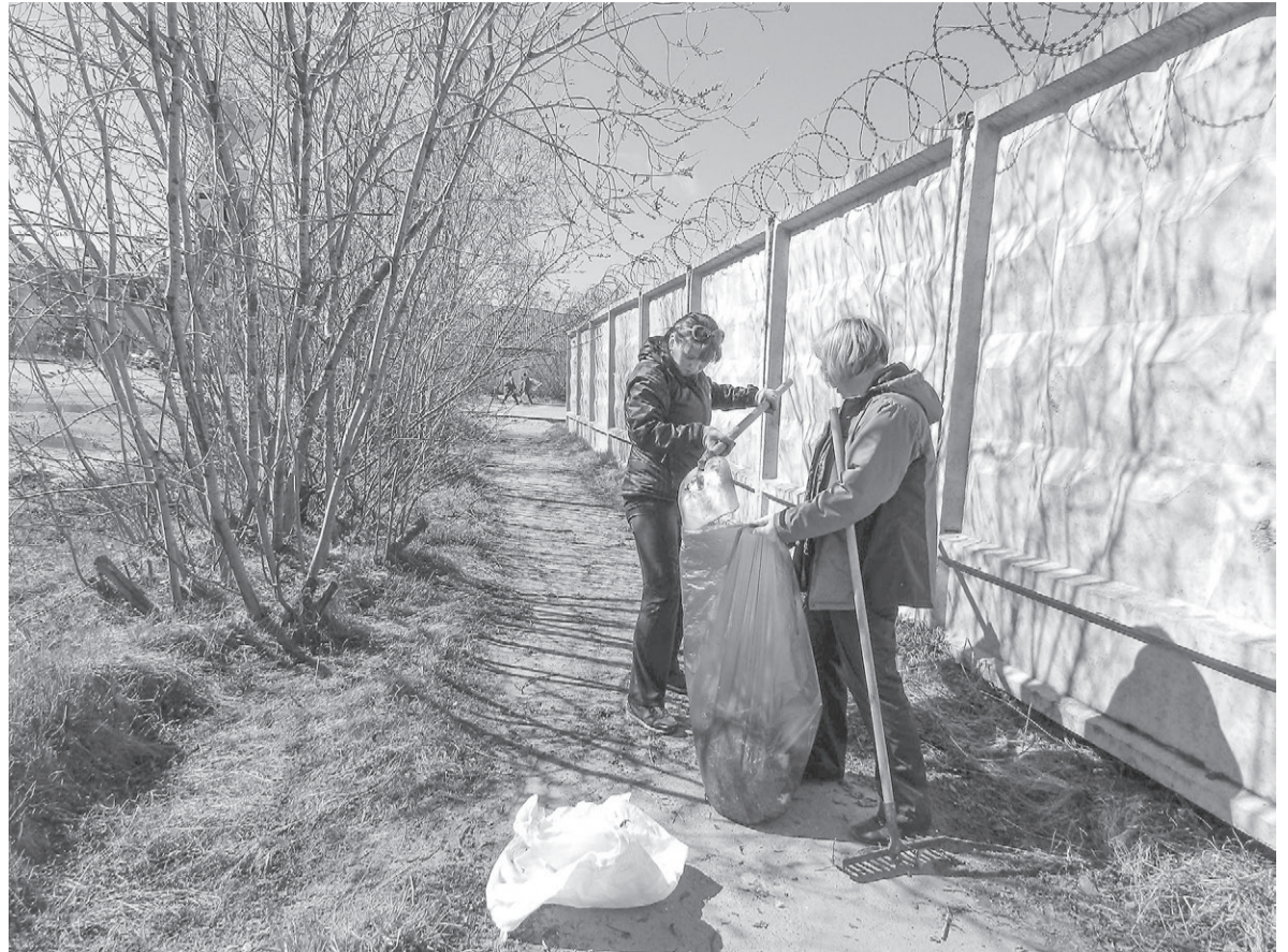
Участники субботника убирают аллею у морского порта

По вопросам вывоза мусора следует обращаться по телефонам «горячей линии»: 4-00-53, +7(981) 650-47-20. По этим же телефонам горожанам можно обратиться, если нужны мусорные пакеты.