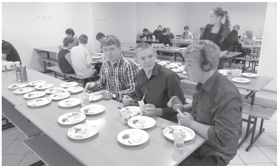
Все учащиеся средних школ обеспечены ежедневным горячим питанием

Обучение в 1-4 классах во всех школах города ведется по федеральным государственным образовательным стандартам нового поколения.