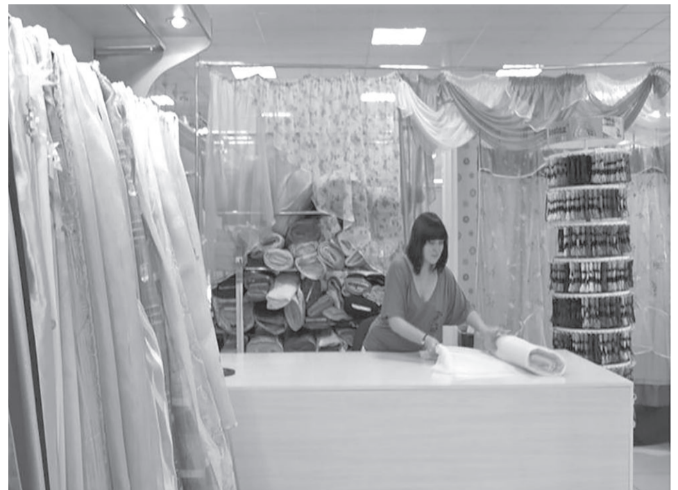
Один из частных магазинов Нарьян-Мара

В отчетный период было приобретено оборудование для проведения городских ярмарочно – выставочных мероприятий. В 2014 году впервые разработан и утвержден порядок организации проведения ярмарок на территории города Нарьян-Мара, в соответствии с которым было проведено 8 ярмарок.