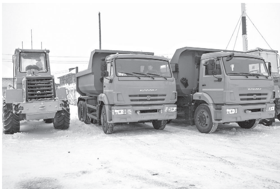
Новая техника, поступившая в «Чистый город»

На ремонт и реконструкцию объектов ЖКХ на территории города в 2014 году было выделено финансирование в сумме более 82 972,2 тыс. руб., освоено 74 217,1 тыс. руб., или 89,4%. Причиной неполного освоения является невыполнение работ по выносу водопровода, экономия от торгов по выполнению ремонтных работ.