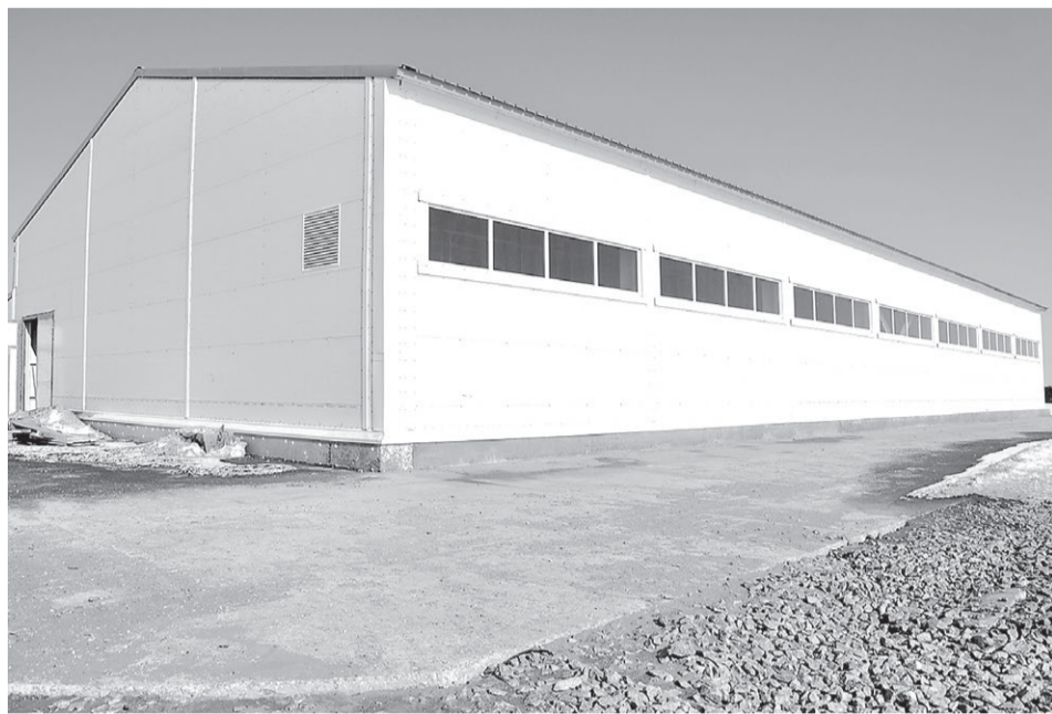
Строительство очистных сооружений в Качгорте

Третья по объему финансирования и самая насыщенная по количеству и разнообразию мероприятий – муниципальная программа «Благоустройство». На её реализацию в 2014 году было предусмотрено 106,4 млн. рублей. Фактическое освоение составило 80,1 млн рублей, или 75,3%.