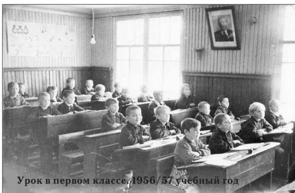
Урок в первом классе, 1956/57 учебный год

Лесозаводе, стала первым вестником образования среди неграмотного населения. Позже школа была преобразована в семилетнюю, а в последующие годы — в среднюю.