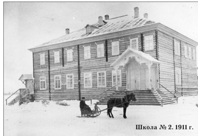
Школа № 2. 1911 г.

Школа № 2 — это не только образовательное учреждение в одном из микрорайонов города, но и центр организации досуга детей, подростков и взрослого населения поселка Лесозавод. Школа продолжает сохранять давнюю традицию — поддерживать связь подрастающего поколения и ветеранов лесозавода, которые являются