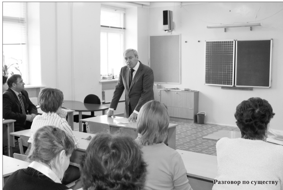
Разговор по существу

целевой программе переселения подлежит сносу. В ближайшие два года в Нарьян-Маре как раз в рамках этой программы запланирован снос 56 домов, в том числе и лесозавод-