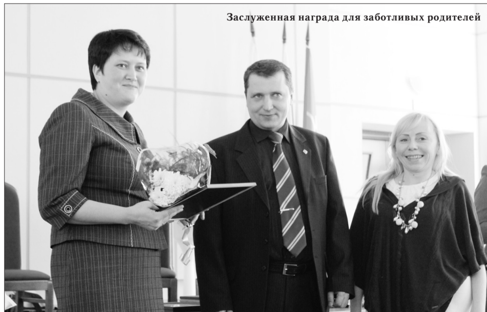
Заслуженная награда для заботливых родителей

ных ценностей и традиций, были героями общегородского родительского собрания. В их адрес звучали слова благодарности за достойное воспитание подрастающего поколения нарьянмарцев. Активная жиз-